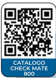
CATALOGO CHECK MATE 800

Dentro de los procesos del cartón, se encuentra la impresión de este por medio de inyección de tintas, para presentaciones personalizadas de las marcas que requieren de empaques de este material.